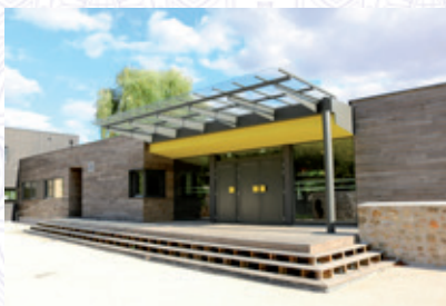
Maison des associations Claude Génot 45bis rue de Rambouillet