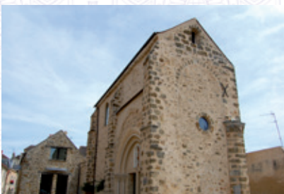
Priuré Saint-Saturnin Centre culturel de Chevreuse Rue de l'Église