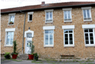
Bibliothèque municipale Jean Racine Place Charles de Gaulle Tél. : 01 30 52 28 64 bibliothequechevreuse.opac-x.com