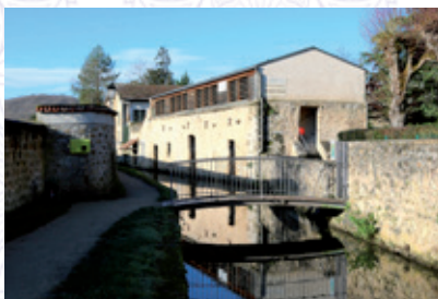
Séchoir à Peaux Salle d'exposition & de concert Promenade des petits ponts (à proximité de l'Hôtel de ville)